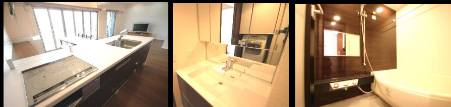
IHヒーター/浴室乾燥機など最新の設備を備えた充実の水回り

平成 26 年完成の築浅物件。美邸！ LDKが約 22.2 帖もある ゆとりの 3 LDK！