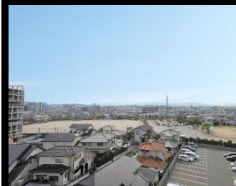
開放的なお部屋からの眺望