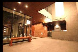
高級ホテルの様なエントランス