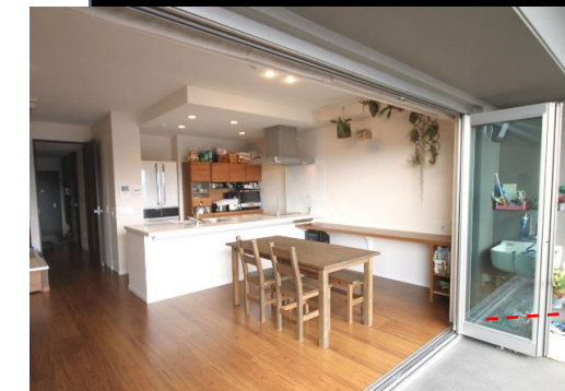
全開口型のオープンサッシュでリビングとバルコニーが一体となり、まるでカフェテラスの様です