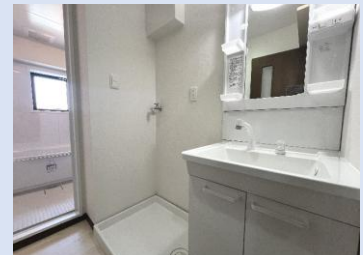
シャワーヘッドを備えた洗面台