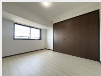
壁一面のワイドな収納付き 洋室2は約6.2帖で主寝室に最適