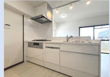
新品のオープンキッチン 食器洗浄乾燥機を完備