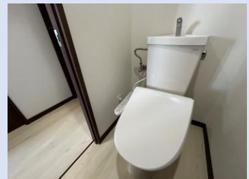
ウォシュレットは新品