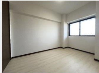
完全独立した洋室1 子供部屋に最適です