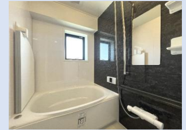
新品の浴室は、爽快快適! 換気窓付き