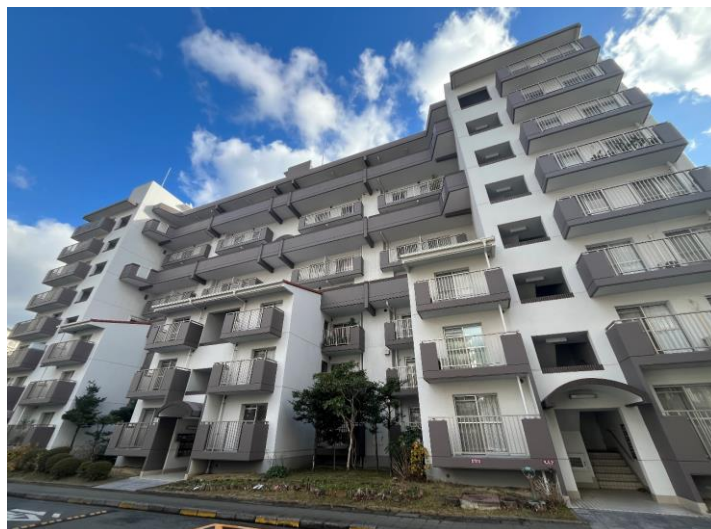
開放的！目の前は校庭