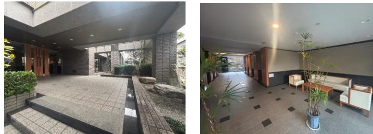
格調高い外観/エントランスホール