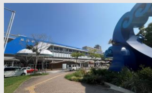
地下鉄姪浜駅 徒歩12分