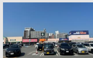
ウエストコート 姪浜 徒歩8分