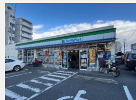
ファミリーマート徒歩3分