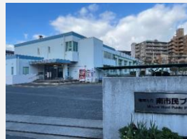
南市民プールとなり