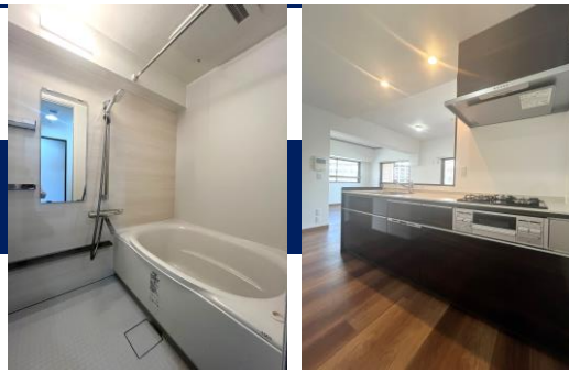
水回り設備は 全て新品