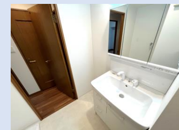
LIXIL製シャワーヘッドを備えた 新品の洗面台は清潔キレイ