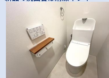
温水洗浄便座付きトイレ