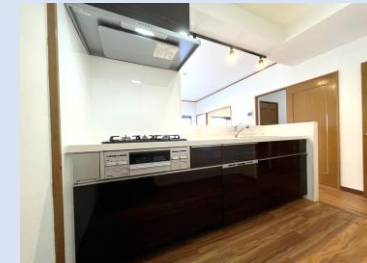
LIXIL製新品のオープンキッチン 食器洗浄乾燥機を完備