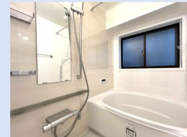
LIXIL製新品の浴室は、爽快快適! 浴室乾燥機を完備。換気窓付き