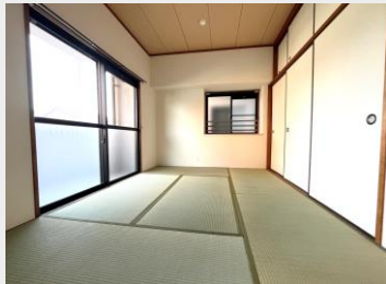
リビングに隣接した本格和室 2面採光で開放的！