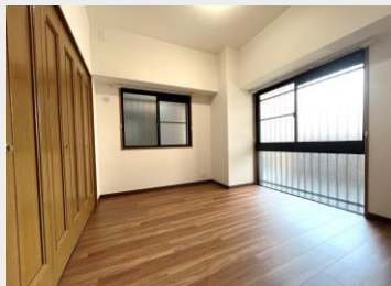
完全独立した洋室1 主寝室に最適です