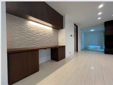
大容量のデスクカウンター 収納があるリビング