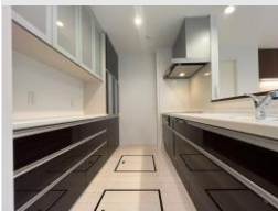
食洗器・IHヒーター を備えたキッチン

敷地面積:291.36㎡ (88.13坪) 1F:76.36㎡ 2F:71.03㎡ 延床面積:147.39㎡ (44.59坪)