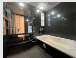
広い!1620サイズ 爽快快適バスルーム