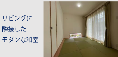
リビングに 隣接した モダンな和室