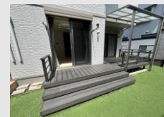
ウッドデッキ付き