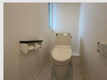
2階にもトイレ/洗面台を設置 忙しい朝も安心