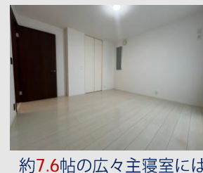
約7.6帖の広々主寝室には 大容量のウォークインクローゼット付き