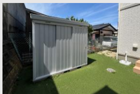
大容量の屋外物置もあり 季節の物やアウトドアグッズの 収納にとっても便利!