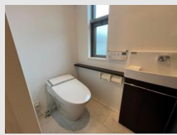
手洗いカウンター ウォシュレット付きトイレ