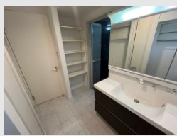
ワイドで収納も豊富な 洗面化粧台