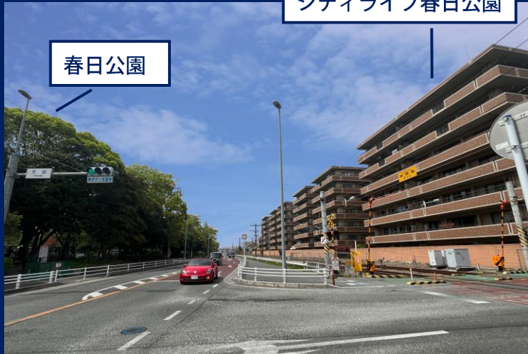
シティライフ春日公園