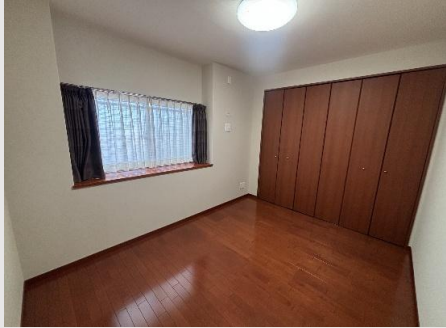
壁一面のワイドな収納を備えた洋室1