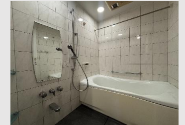
浴室乾燥機も備えた爽快快適バスルーム