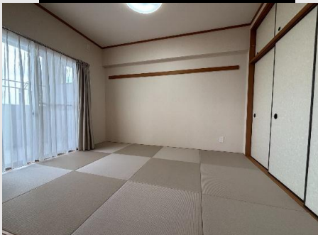
琉球畳を施したモダンな和室