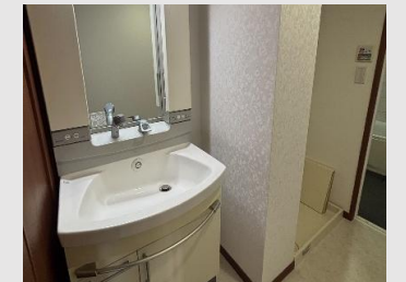
シャワーヘッドを備えた機能的な洗面台