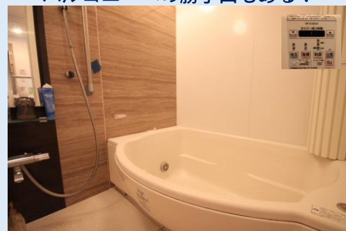
浴室乾燥機も備えた 爽快快適バスルーム