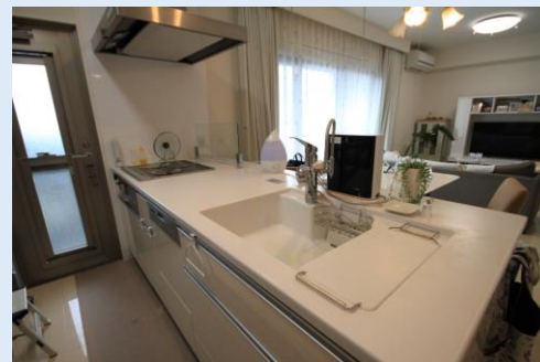
食洗器付きのキッチン バルコニーへの勝手口もある！