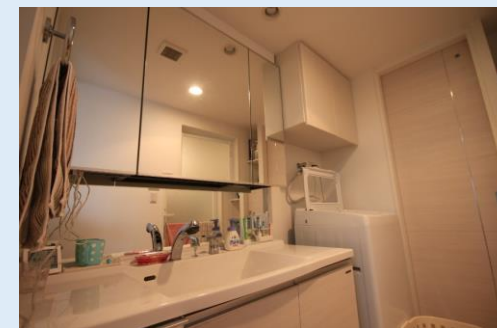
キッチンから洗面室へ直接行ける！ 3面鏡タイプの洗面台