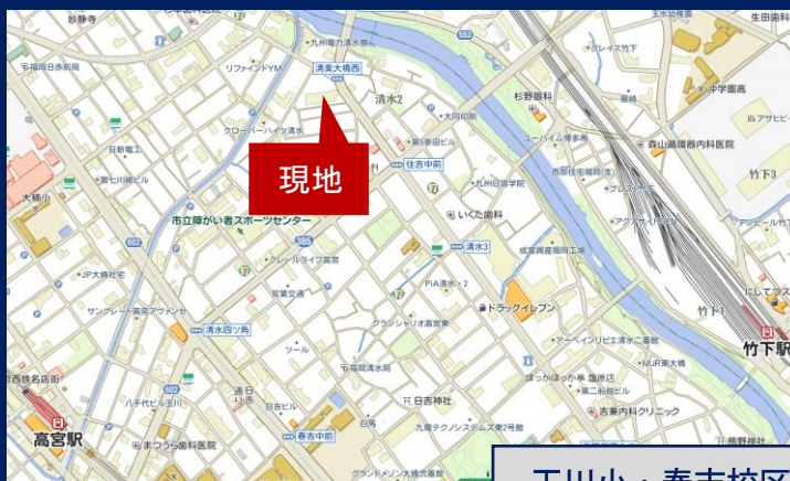
玉川小・春吉校区