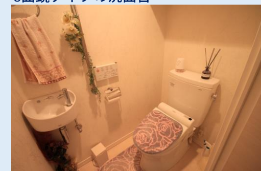
温水洗浄便座・手洗いカウンター を設けたトイレ