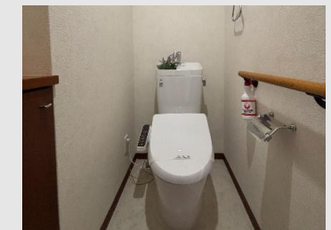
ウォシュレット付きトイレ