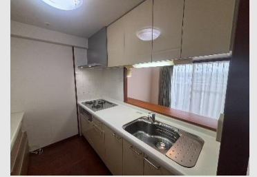
開放的なオープンタイプのシステムキッチン