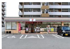
セブンイレブン 徒歩 10 分