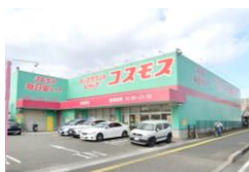
コスモス 徒歩 5 分