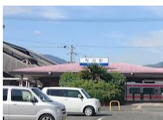
西鉄 桜台駅 徒歩 9 分