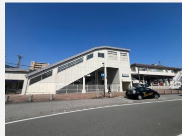
西鉄筑紫駅 徒歩7分