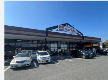
マックスバリュ 徒歩4分