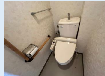
温水洗浄便座付きトイレ