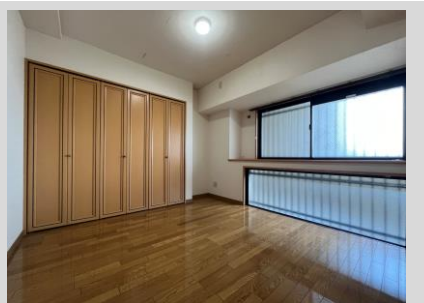
約6.5帖の洋室①は主寝室に最適