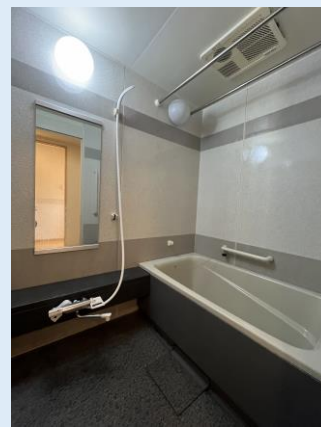
爽快快適バスルーム 浴室乾燥機を備えています