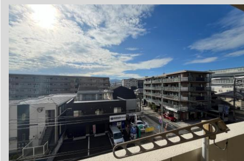
バルコニーからの開放的な眺望