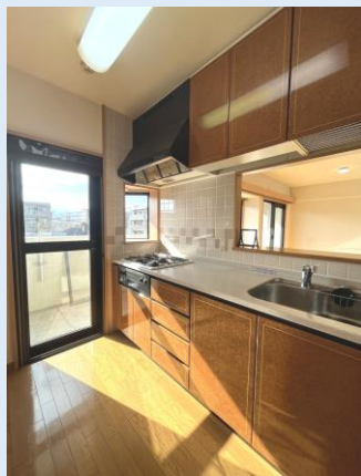
バルコニーへの勝手口も便利 人気のカウンターキッチン