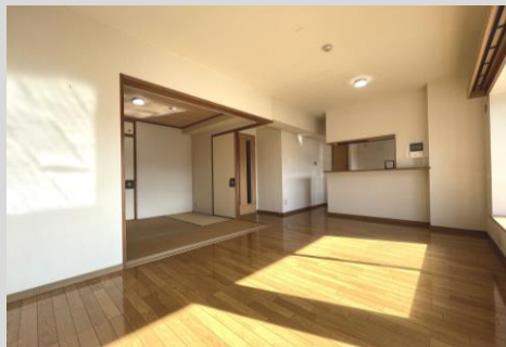
南向き！バルコニー面にワイドな リビングは家具のレイアウトがしやすい！