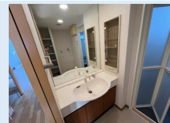
大型ミラーのとても綺麗な洗面台