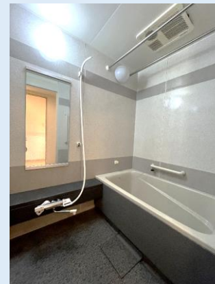
爽快快適バスルーム 浴室乾燥機を備えています