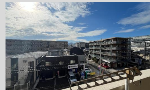
バルコニーからの開放的な眺