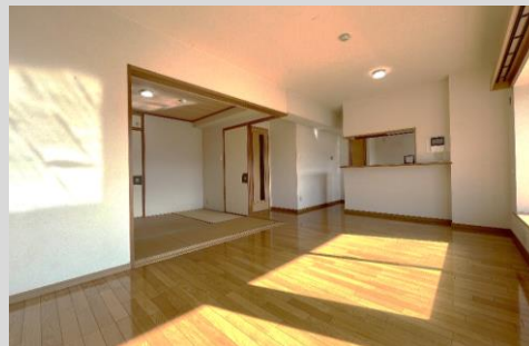
南向き！バルコニー面にワイドな リビングは家具のレイアウトがしやすい！