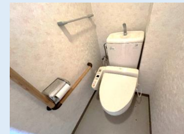
温水洗浄便座付きトイレ