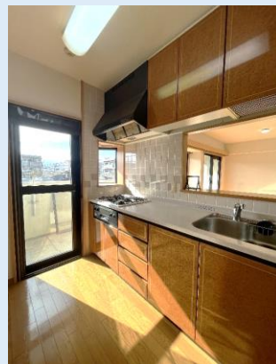
バルコニーへの勝手口も便利 人気のカウンターキッチン