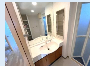
大型ミラーのとても綺麗な洗面台