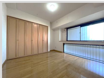
約6.5帖の洋室①は主寝室に最