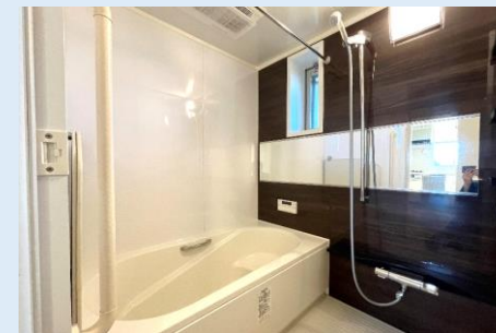
爽快快適バスルーム換気窓や 浴室乾燥機を備えています