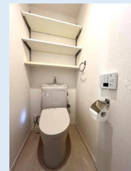
温水洗浄便座付き 収納棚も豊富なトイレ