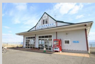
市営渡船西戸崎 徒歩 4分