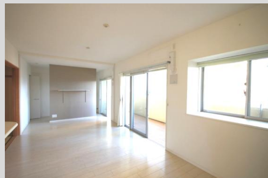
バルコニー面にワイドな横長リビングは約21.2帖