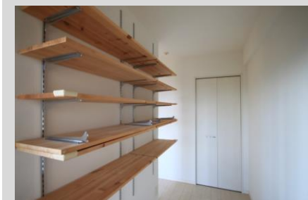
LDKの仕切り壁はTVも置きやすい 裏面は可動棚で物の整理に便利