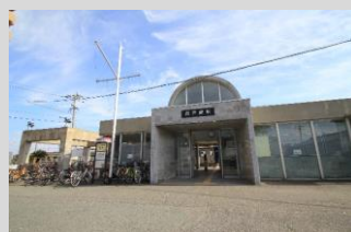
JR西戸崎 徒歩 5分