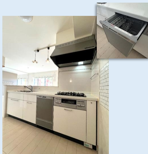
人気のカウンタータイプシステムキッチン 食器洗浄乾燥機付き