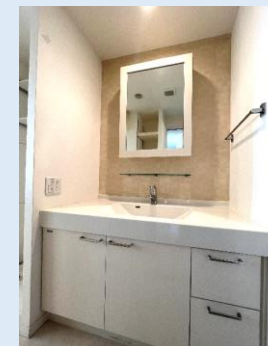
お洒落なミラーが 付いた洗面台