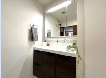
シャワーヘッドを備えた新品の洗面