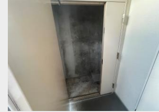
季節物の収納に便利なトランクルーム