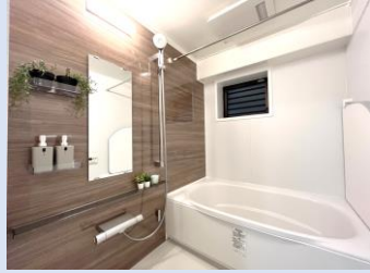
浴室乾燥機/換気窓付き新品の浴室