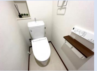
温水洗浄便座付き新品トイレ