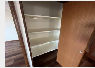
リビングやホールの豊富な収納