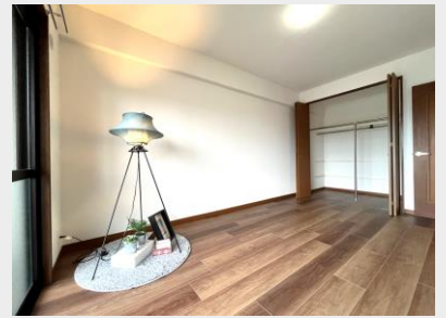
最も広い洋室①は約7.1帖。主寝室に最適! バルコニー側なので、プライバシーも確保! ウォークインクローゼット付き!