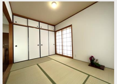
大容量の押入を備えた本格和室 2面採光で明るい