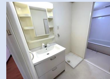
シャワーホースも備えた 機能的でキレイな洗面化粧台