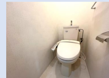
温水洗浄便座付きトイレ