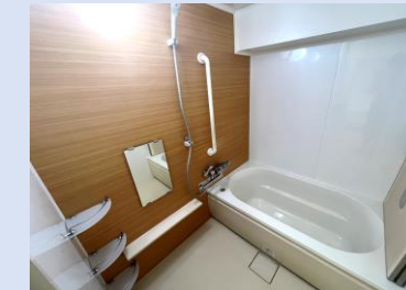
爽快快適！一日の疲れを癒す バスルーム