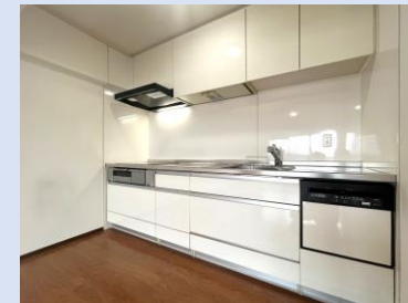
IHクッキングヒーターを備えた システムキッチン。食器洗浄乾燥機付き