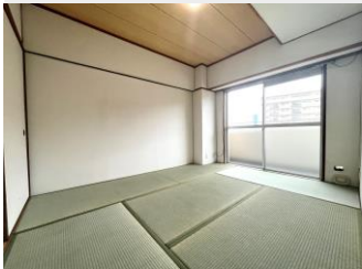
専用バルコニーがある 本格和室は主寝室に最適