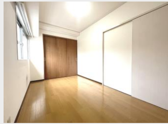
リビングから離れた独立性のある 洋室はプライバシーに優れてます