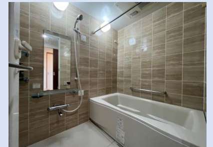
浴室乾燥機を備えたバスルーム