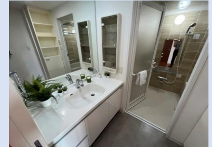
大型ミラー/サイドキャビネット付き洗面台