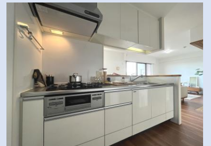
開放的なカウンタータイプキッチン