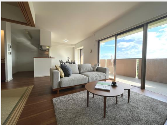
バルコニー面に横長のリビングは 家具の配置がしやすい！約17.5帖の広さ！