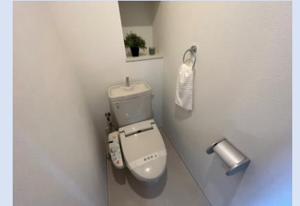
温水洗浄便座付きトイレ