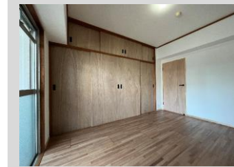
壁一面の 大容量収納を 備えた洋室①