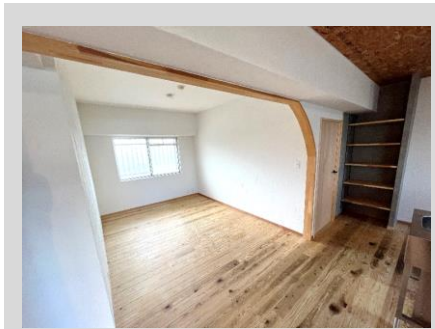
アールのデザインが お洒落なLDK