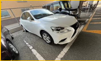
敷地内の 平置き駐車場確保