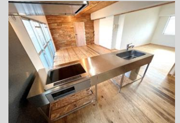
シンプルモダンなキッチン IHヒーター完備