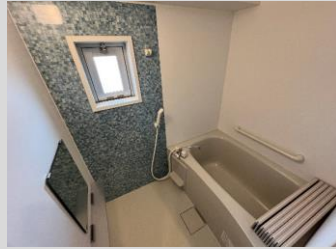
爽快快適バスルーム 換気窓を備えています