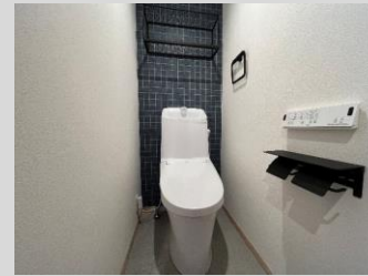
温水洗浄便座付きトイレ