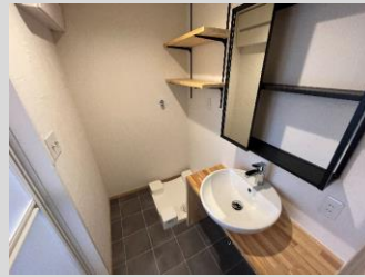
個性的でお洒落な洗面台