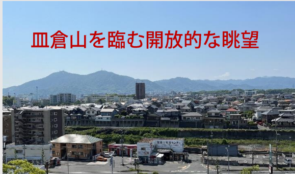
皿倉山を臨む開放的な眺望