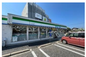
ファミリーマー徒歩3分