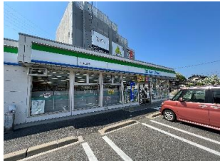
ファミリーマート