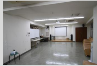
シアタールームも兼ねた 集会室