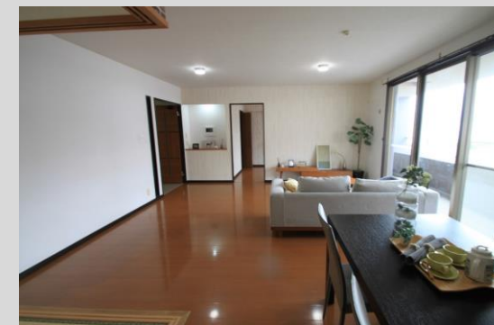
LDKは約20.5帖の広さ！ハイサッシュで明るい！