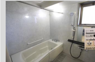
1620サイズの広々バスルーム 浴室乾燥機を備えています