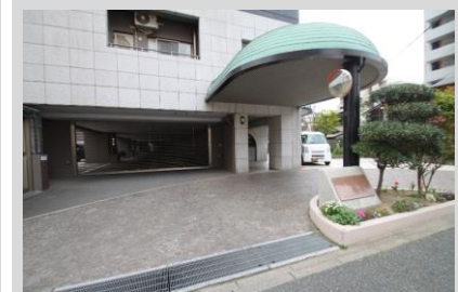
車寄せのあるアプローチ 駐車場入り口には シャッターゲートを設置