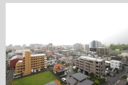
遮るものがない 10階からの開放的な眺望