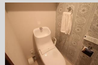
温水洗浄便座付きトイレ