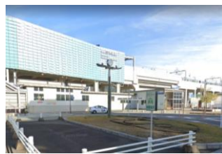
西鉄白木原駅 徒歩5分