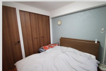
約6.0帖の洋室は主寝室に最適