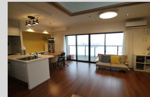
床暖房を備えたLDKは約16.7帖！