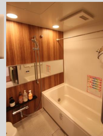
爽快快適バスルーム 浴室乾燥機を備えています