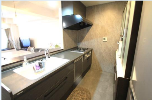
人気のカウンタータイプシステムキッチン 食器洗浄乾燥機付き