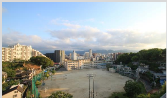
南側は学校のグラウンドなので開放的な眺望が広がります