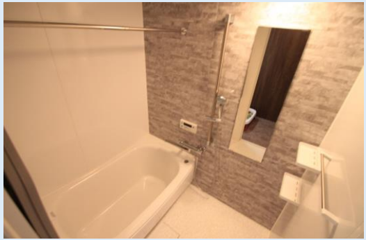
爽快快適バスルーム浴室暖房を備えています