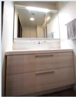
大型の3面鏡タイプの洗面台