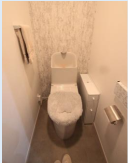
温水洗浄便座付きトイレ