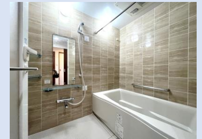
浴室乾燥機を備えたバスルーム