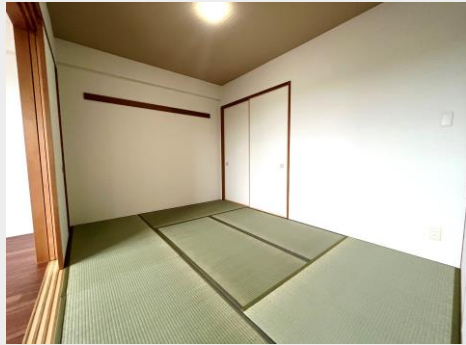
リビングに隣接した6帖の本格和室