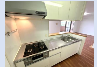
開放的なカウンタータイプキッチン