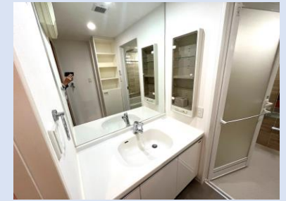
大型ミラー/サイドキャビネット付き洗面台