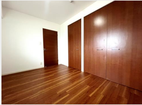
壁一面の大容量クローゼット付き洋室1は主寝室に最適