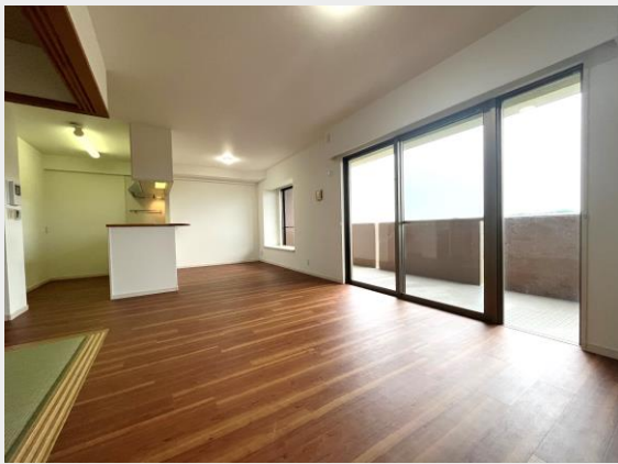
バルコニー面に横長のリビングは 家具の配置がしやすい！約17.5帖の広さ！