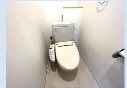
温水洗浄便座付きトイレ