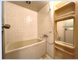
爽快快適バスルーム