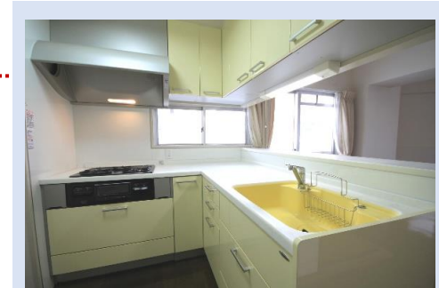
使い勝手の良いL字型のキッチン窓に面しており、明るい！