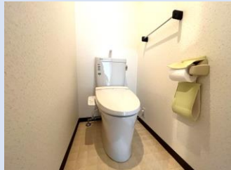
温水洗浄便座付きトイレ