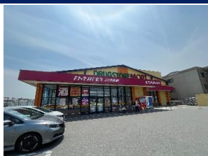
ドラッグストアモリ 徒歩 6 分 二日市小・二日市中校区