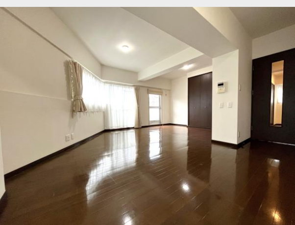
2面採光の明るいLDKはなんと約20.8帖の広さ！