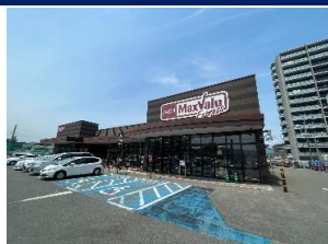
マックスバリュ 徒歩 6 分