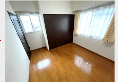
リビングから離れた独立性のある洋室①は主寝室に最適