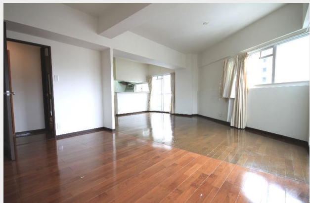
2面採光の明るいLDKはなんと約20.8帖の広さ！