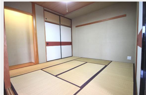
マンションでは珍しい広々8畳の本格和室