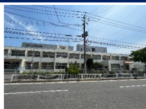
二日市小学校 徒歩 1分