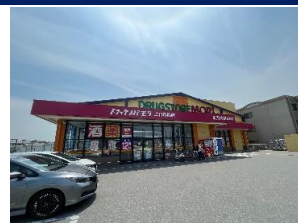
ドラッグストアモリ 徒歩 6分 二日市小・二日市中校区