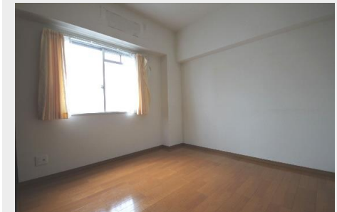
リビングから離れた独立性のある洋室①は主寝室に最適