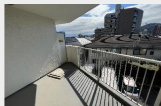
奥行きがあり、テーブルなども置けるバルコニー