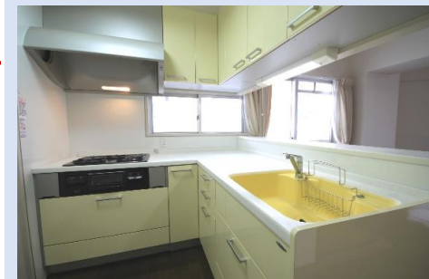
使い勝手の良いL字型のキッチン窓に面しており、明るい！