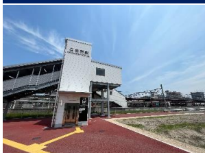
JR二日市駅 徒歩 3分