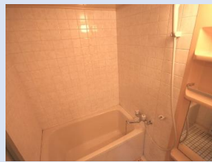
爽快快適バスルーム