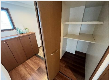
玄関ホールには、大容量の共用物入があります