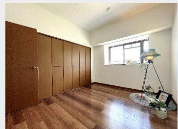
壁一面の豊富な収納を備えた洋室②