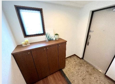
ゆとりの玄関ホール。採光窓があり、明るい！