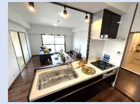
オープンタイプで開放的 機能的なシステムキッチン