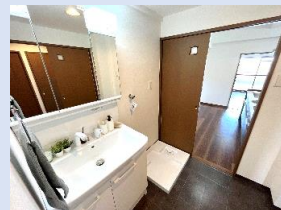
シャワーヘッドを備えた洗面台 キッチンへの導線も便利！