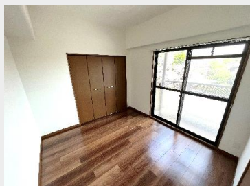
バルコニーに面した解放感のある洋室③