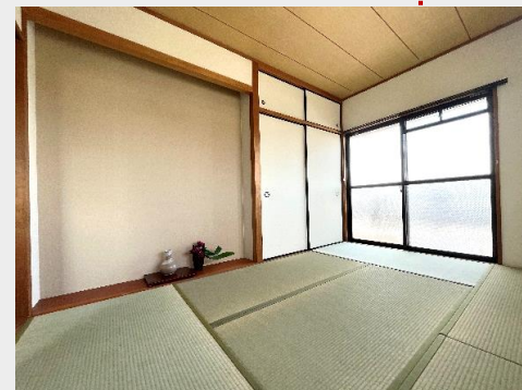
バルコニーに面した 独立性のある和室は 客間としても重宝できます