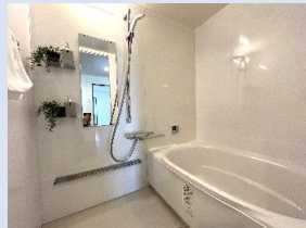
新品の浴室は、爽快快適！