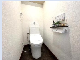
温水洗浄便座付きトイレ