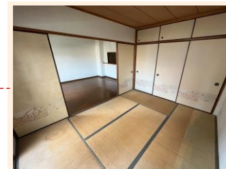
大容量 1間半の 押入を備えた和室 客間にも使えます