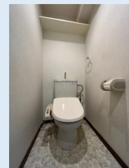
温水洗浄便座付きトイレ