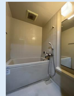
爽快快適バスルーム