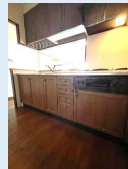
人気のカウンターキッチン