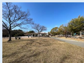
塩原中央公園 徒歩 4 分