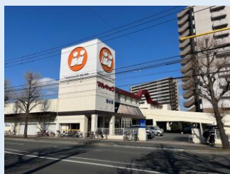
マルキョウ 徒歩 3 分