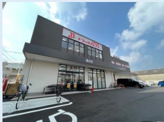
ドラッグイレブン 徒歩 2 分