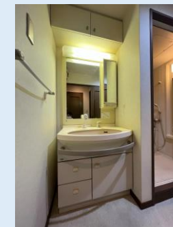
シャワーヘッド付き洗面台