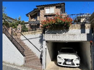
電動シャッター付きガレージ