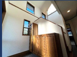
高い吹抜けのある玄関