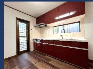
安全安心のオール電化住宅