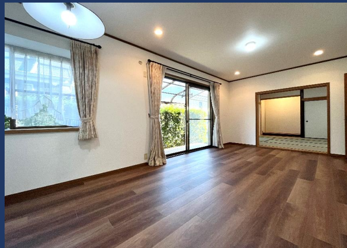
南面にワイドな明るいリビング・ダイニング