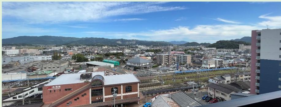
遮るものがない 最上階からの 開放的な眺望！