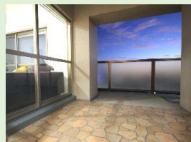
ハイセンスなタイル柄フロアの 中庭風インナーバルコニー