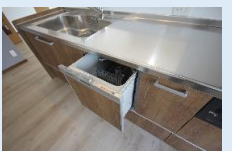
デザイン性に優れた 新品のキッチン 食器洗浄乾燥機を設置した 機能的なキッチンです