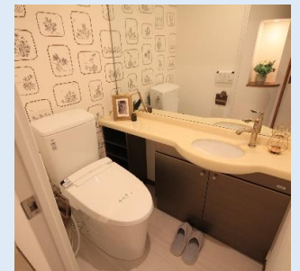
温水洗浄便座付き 多機能トイレ