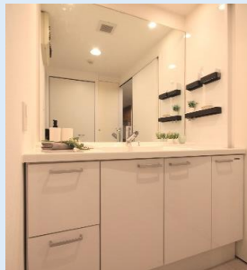
大型ミラーを備えた ハイセンスな洗面化粧台