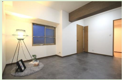
約8.5帖のゆとりある洋室1は ウォークインクローゼット付き