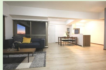
圧巻の広さと開放感! 約19.3帖の広々LDK