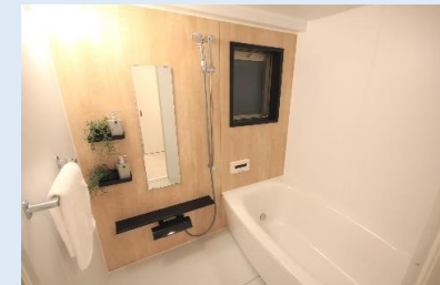
一日の疲れを癒す、 快適爽快バスルーム