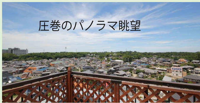
圧巻のパノラマ眺望