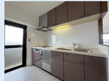
IHヒーター/食洗器付きキッチン 勝手口もあり、便利で明るい