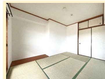
バルコニー面に 4 室配置された ワイドスパンの明るいお部屋です！