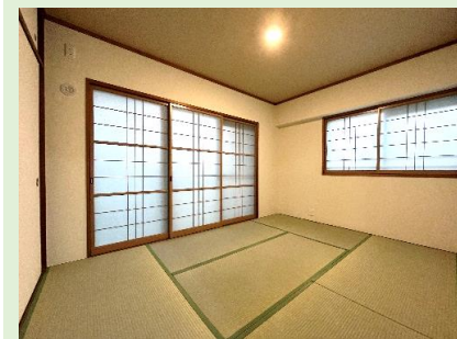
リビングの隣に配置された本格和室 客間としても重宝できます

フロアタイルを新調！ 住戸の中心にリビングがあり 家族のコミュニケーションが取りやすい！