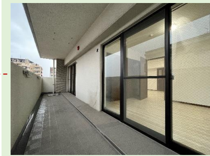
2面バルコニーで開放的なお部屋です