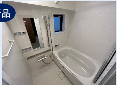
新品！一日の疲れを癒す バスルームは浴室乾燥機を完備！