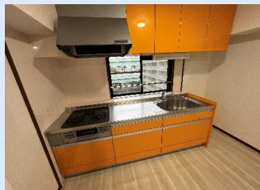
大きな換気窓があり開放的！ とてもキレイなシステムキッチン