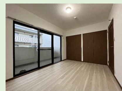
壁一面の大容量クローゼットを設けた洋室1 約6.3帖の広さで主寝室に最適