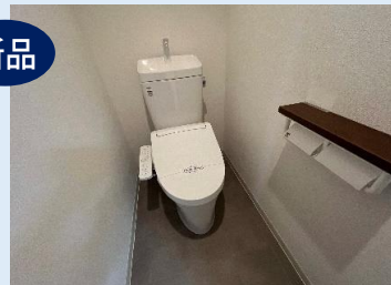
新品！温水洗浄便座を備えた 多機能トイレ