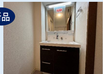
新品！三面鏡タイプの洗面台 シャワーヘッドも備えて機能的