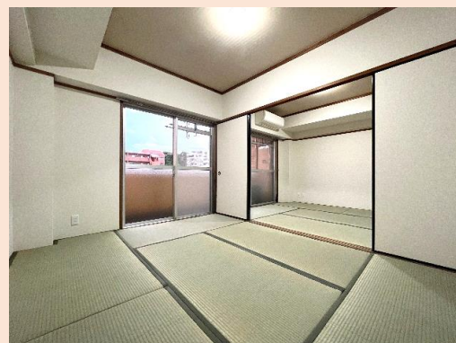
明るい南面の和室。広げて使うことも 各々居室として利用することも可能です