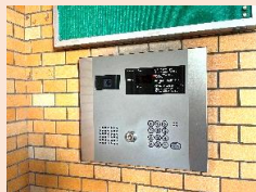
モニター付き オートロック完備