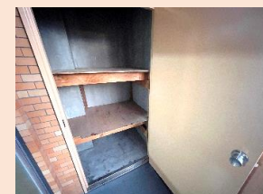
アウトドアグッズや 季節の物の収納に 便利なトランクルーム