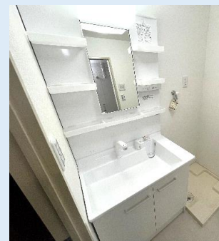
洗面化粧台は 新品に交換