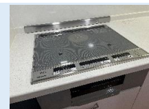
デザイン性に優れた システムキッチン IHコンロ/レンジフードは 新品に交換