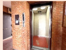
エレベーター完備