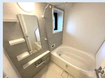
換気窓/浴室乾燥機を備えた 爽快快適バスルーム。