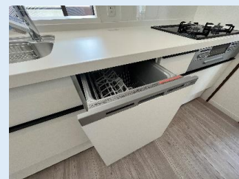
便利な勝手口もある カウンターキッチン