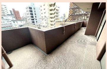
洋室1にはプライベートバルコニー もあります