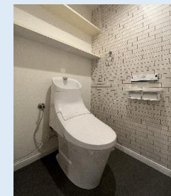
温水洗浄便座付き 多機能トイレ