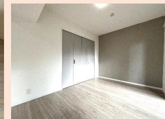
全居室が洋室のプランです。個室を要する ご家族にピッタリ