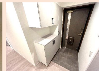
下足入/ドア建具も全て新品