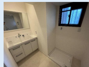
換気窓がある洗面室 デザイン性に優れた洗面台