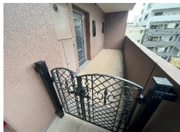
玄関には一戸建てのような門扉を備えています