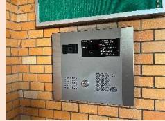
モニター付き オートロック完備