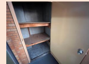
アウトドアグッズや 季節の物の収納に 便利なトランクルーム