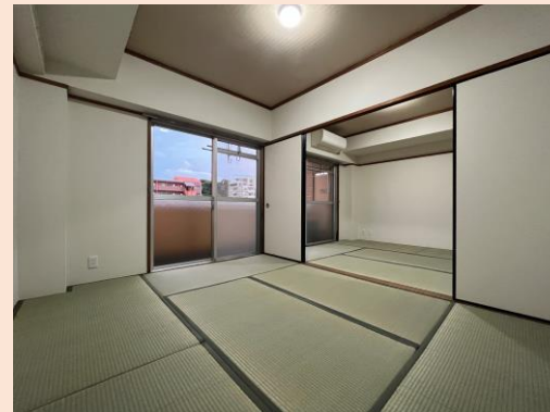
明るい南面の和室。広げて使うことも 各々居室として利用することも可能です