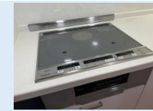
デザイン性に優れた システムキッチン IHコンロ/レンジフードは 新品に交換