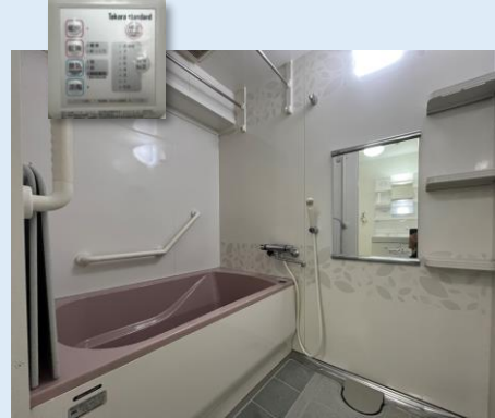
浴室乾燥機を備えた 機能的でキレイなバスルーム。