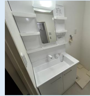
洗面化粧台は 新品に交換