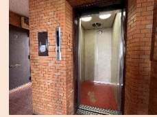
エレベーター完備