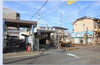
JR笹原駅 徒歩 3 分