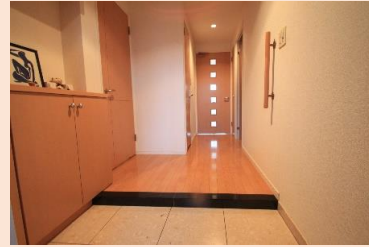
玄関ホールには 大容量の下足入を設置