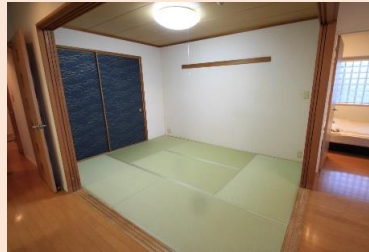
リビングに隣接した本格和室！