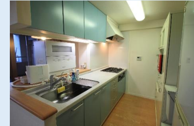
リビングを見ながら調理が出来る、 人気のカウンターキッチン！