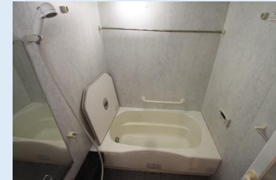
一日の疲れを癒す 浴室乾燥機付きバスルーム。