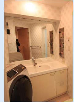
大型ミラーを備えた 機能的な洗面台