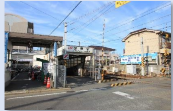
JR笹原駅 徒歩 3 分