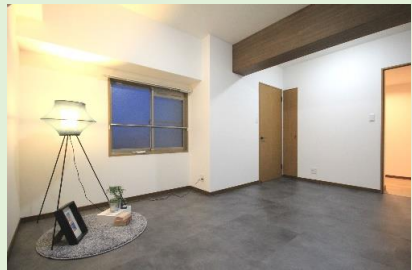
約8.5帖のゆとりある洋室1は ウォークインクローゼット付き