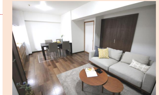
住戸のセンターにリビングがある間取り 家族のコミュニケーションもとやすい！