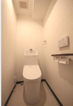
温水洗浄便座付き 多機能トイレ