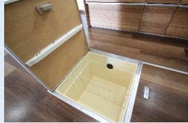
キッチン前に食品庫としても使える 床下収納付き