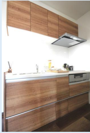
IHクッキングヒーターを備えた 新品のシステムキッチン