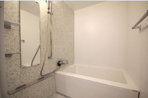
一日の疲れを癒す 新品の爽快快適バスルーム。