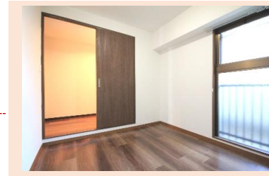
リビングから離れた 独立性のある洋室