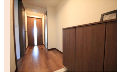
下足入や ドア建具も新調 フルリフォーム済