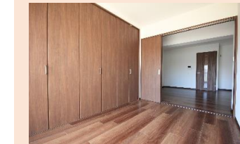
壁一面に大容量の クローゼットを備えた洋室 お部屋もスッキリします