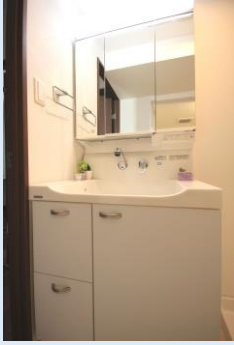
鏡の裏側は豊富な収納 新品の洗面台