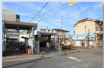
JR笹原駅 徒歩 3 分