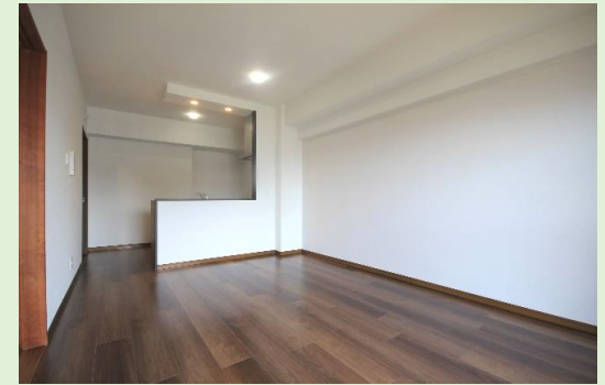
スマートな家具のレイアウトが出来るLDKは約 12.6 帖の広さ