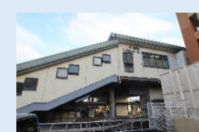
JR千鳥駅 徒歩 2 分