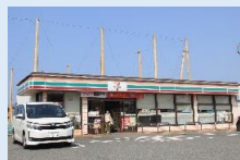
セブンイレブン 徒歩 5 分