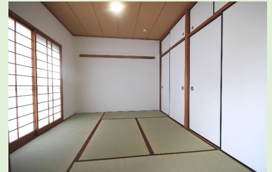
リビングに隣接した本格和室2間の大容量押入れを備えています