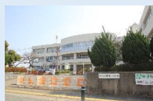
花見小学校 徒歩 6 分