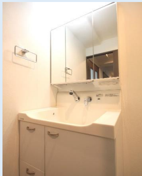
鏡の裏が収納になったシャワーヘッド付き洗面台