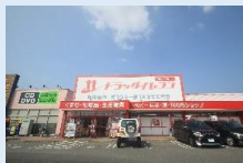
ドラッグイレブン 徒歩 3 分