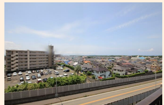
遮るものが無い開放的な景色が広がります