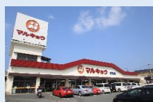
マルキョウ 徒歩 4 分