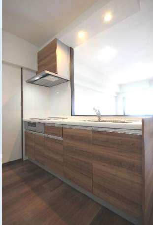
IHヒーターも備えた人気のオープンキッチンです