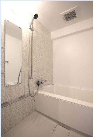
一日の疲れを癒す、快適爽快バスルーム