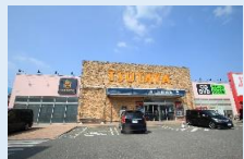
TSUTAYA 徒歩 4 分