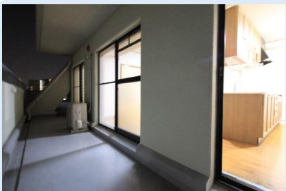
2面バルコニーの角部屋