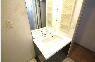
シャワーヘッドを備えた洗面台