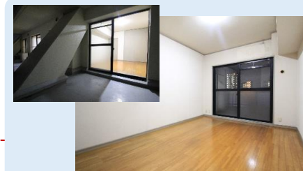
LDKや他の居室とは完全に独立した プライベートバルコニーもある洋室1は 主寝室に最適