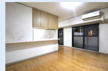
バルコニー面にワイドな明るいLDK リビングの様子を見ながら料理が出来る 人気のカウンタータイプキッチンです