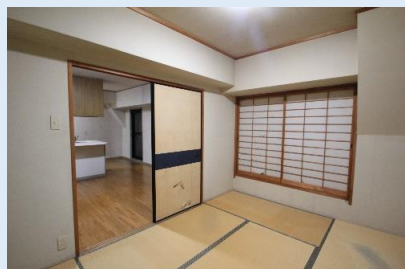
リビングに隣接した2面採光の和室 襖を開放すると広々空間に！