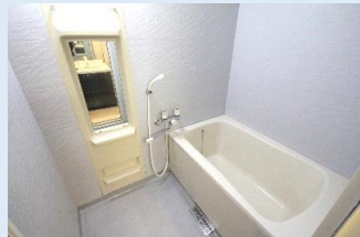
爽快快適バスルーム