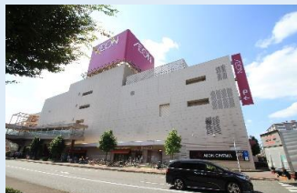
イオン大野城ショッピングセンター 徒歩 7 分