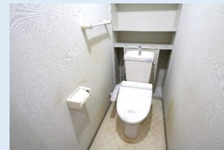
トイレには 温水洗浄機便座付き。