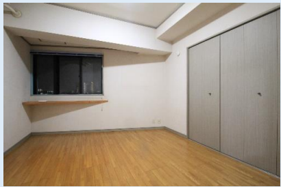
ワイドなクローゼットを備えた洋室