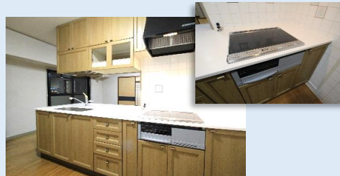
IHクッキングヒーター付き 勝手口も近いキッチン