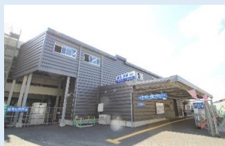
西鉄天神大牟田線「春日原駅」 徒歩 6 分