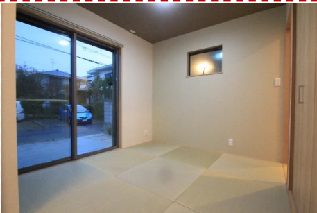
リビングに隣接した本格和室。扉を開放すると リビングと一体となった広々空間になります。 客間としても使えます。