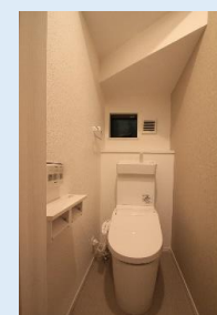
温水洗浄便座付き 多機能トイレは 1階・2階に設置