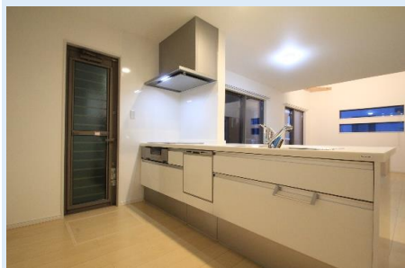
リビングを見渡すカウンタータイプのキッチン、勝手口付き。 IHクッキングヒーターや食器洗浄乾燥機や床下収納を完備。