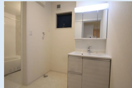
キッチンから洗面室へ近い動線は、 家事をするのにとっても便利です。