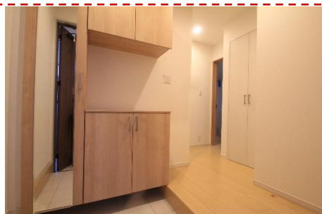
住まう方を暖かく迎え入れる玄関ホール 大容量のシューズBOX、豊富な共用収納もあります