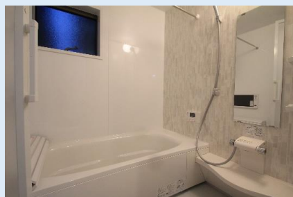
一日の疲れを癒す快適爽快バスルーム 浴室TVや浴室乾燥機等、充実の設備も完備。