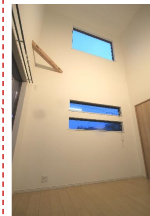
高い吹抜のあるリビング 高所にも採光窓を設置し 開放感あふれる空間になっています。