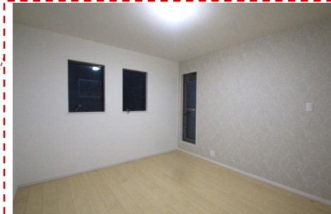
2階居室は全てのお部屋がバルコニーに面しています