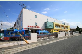
美和台幼稚園 徒歩6分