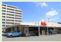
スーパー M's 徒歩10分