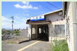
西鉄貝塚線 三苦駅 徒歩10分