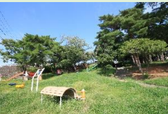
美和台中央公園 徒歩5分