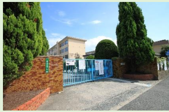
美和台小学校 徒歩5分