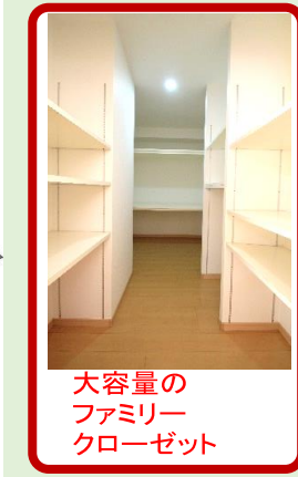
大容量のファミリークローゼット