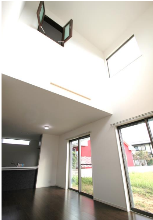
高い吹抜のある Living room