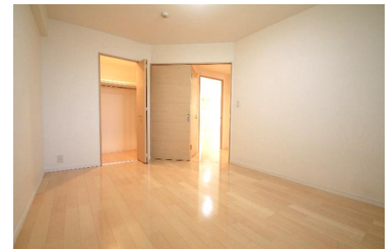
ウォークインクローゼットを備えた洋室Aは約7.2帖の広さ!