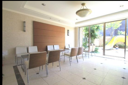
高級ホテルの様なエントランスホール