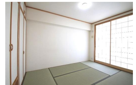
南面バルコニー側に配した本格和室は客間としても利用可能。大容量の押入れもあります