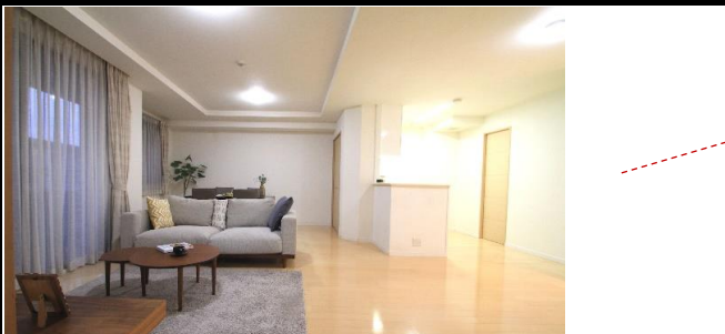
天井近くまで採光面のあるハイサッシュのLDKは約20.0帖の広さ!