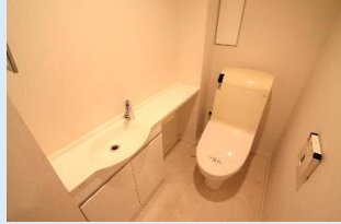
手洗いカウンター/温水洗浄便座を備えた多機能トイレ