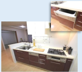
食器洗浄乾燥機を備えた機能的なシステムキッチン