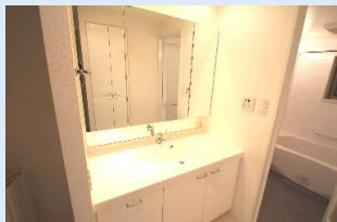
3面鏡タイプのワイドな洗面台もとても奇麗!