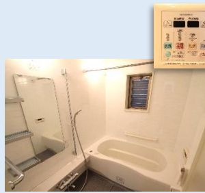
浴室換気乾燥機/換気窓を備えた充実のバスルーム