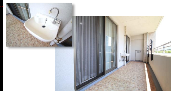
上質なタイル柄のシートが施されたワイドバルコニー掃除/ガーデニング等に便利なスロップシンク付き!